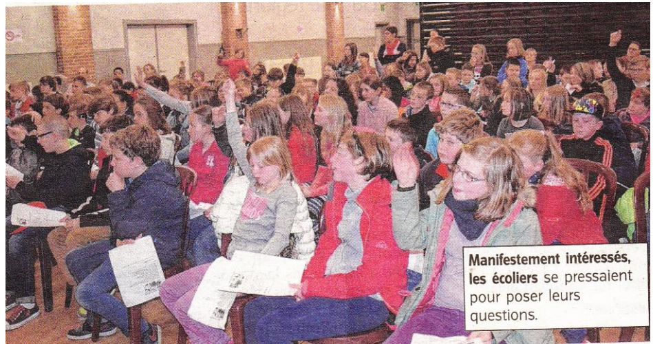
Manifestement intéressés, les écoliers se pressaient pour poser leurs questions.

Voilà le défi que se sont lancé le centre culturel et les écoles de l'entité de Momignies. Ce mardi matin, les 150 élèves de 5 ème et 6 ème primaire étaient invités à rencontrer des réfugiés du centre de Couvin pour échanger sur l'exil d'hier et d'aujourd'hui.