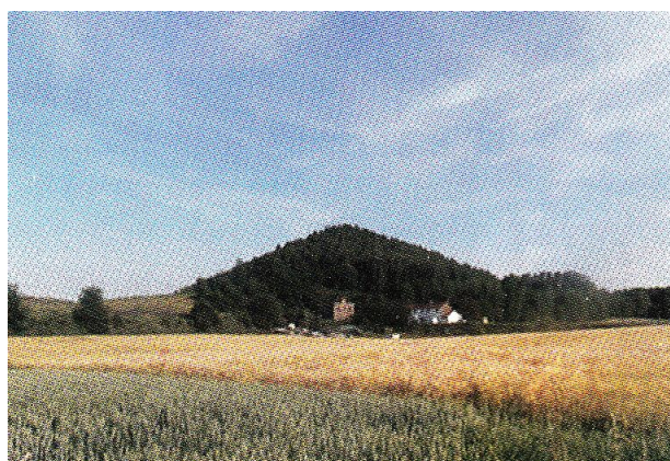
Du 1 er étage de la maison, on aperçoit à l'arrière la fameuse mine « Marcasse » où Van Gogh a voulu descendre pour expérimenter les conditions dans lesquelles les mineurs travaillaient.

Sur notre bonne lancée de reprise, la prochaine rencontre du groupe aura lieu le jeudi 24 novembre à 10h à Flawinne.