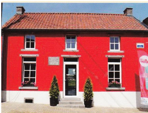
Maison où Van Gogh a vécu à Petit-Wasmes.

Une chambre très simple a été aménagée, telle qu'elle aurait pu être à l'époque, pour héberger à l'occasion des artistes en résidence.