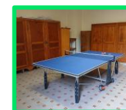
Salle de tennis de table